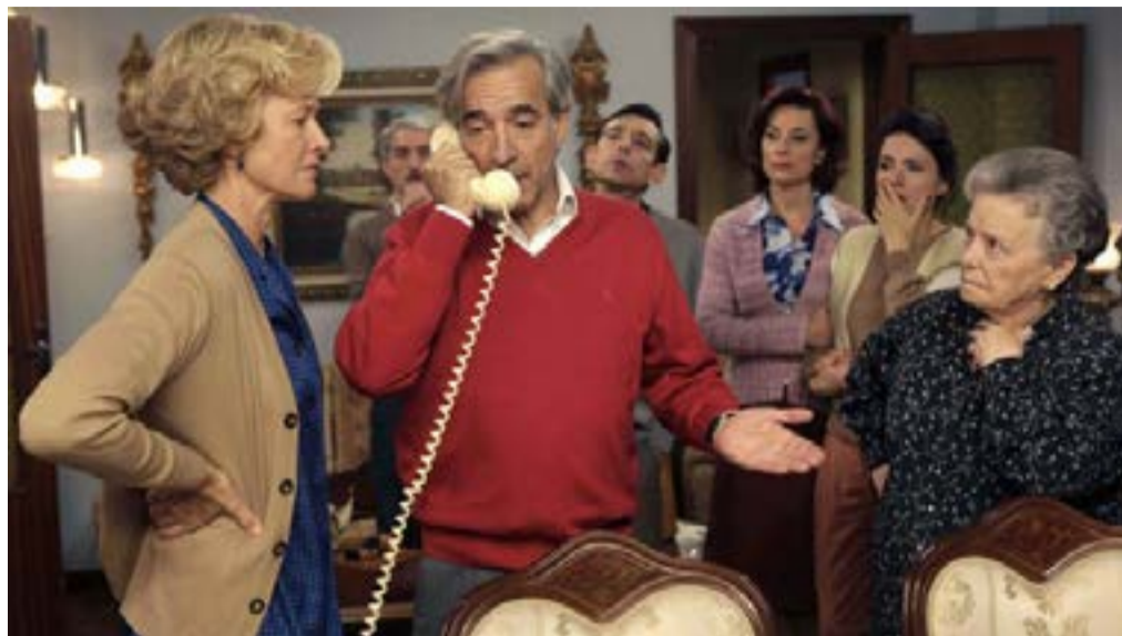
Imanol Arias como Antonio Alcántara en la serie Cuéntame cómo pasó

I.A.: Cuéntame cómo pasó es una serie que tiene una cosa que es nostalgia histórica muy especial. Uno tiene nostalgia de ver cosas que recuerdan de una forma concreta. Para hablar de lo de ahora sería tan multi formalmente diferente... Habría muchas escenas con dos pantallas de gente mandándose whatsapp y sms. Sería una serie muy tecnológica.