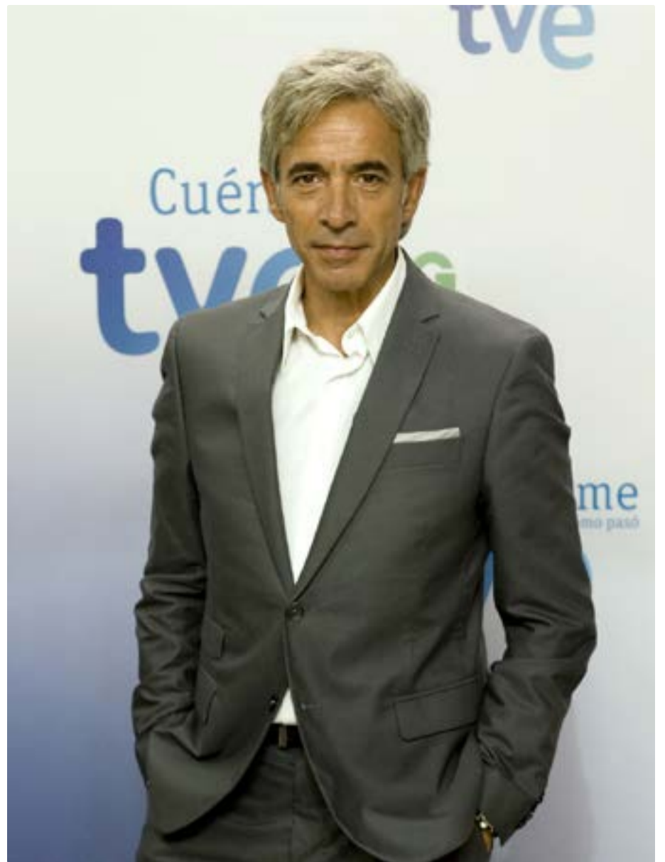
Imanol Arias posa durante un evento organizado por TVE

En reconocimiento a su extensa carrera cinematográfica, recibió en 2003 el Premio Málaga.