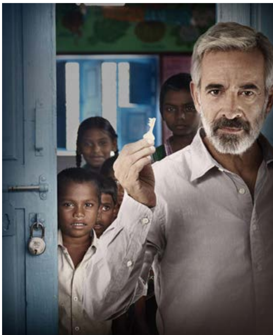
Imanol Arias en el cartel publicitario de la ONG con la que colabora

Con la difícil situación que estamos viviendo en los últimos años, da gusto ver que hay actores que se involucran en causas solidarias para aportar su granito de arena y hacer la crisis algo más llevadera. Imanol Arias, que a lo largo de su carrera ha participado en proyectos solidarios de diferentes ONG's y organizaciones, es uno de esos ejemplos.